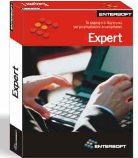
Συνοπτική Εικόνα Επιχείρησης